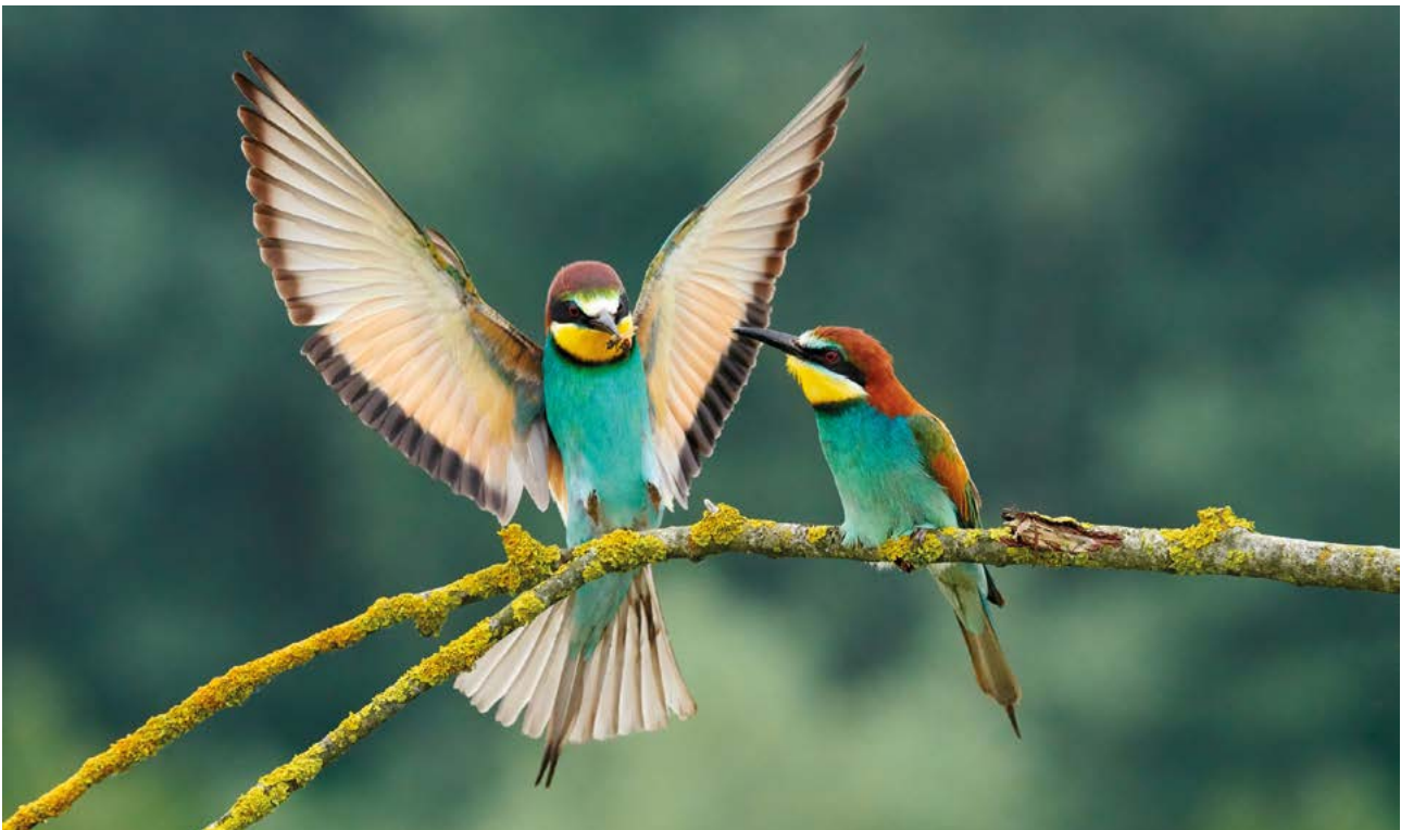
Abb. 1: Der wärmeliebende Bienenfresser ( Merops apiaster ) aus dem Mittelmeerraum brütet inzwischen in vielen Regionen Deutschlands.

Zwangsläufig lassen sich Auswirkungen aus den Veränderungen der Klimazonen und damit auch der Vegetationszonen ableiten. Wie einschneidend diese Auswirkungen auf die biologische Vielfalt sein werden, hängt maßgeblich davon ab, mit welcher Geschwindigkeit sie eintreten. Bei einer Temperaturerhöhung von 1 °C ist von einer Verschiebung der Vegetationszonen um etwa 200–300 Kilometer in Richtung der Pole bzw. um 200 Höhenmeter auszugehen (JENTSCH & BEIERKUHNEIN 2003). Nach den Vorhersagen des IPCC (2002) kann es in den gemäßigten Breiten je nach Klimaszenario zu einer Verlagerung der Klimazonen um bis zu 1 200 km nach Norden kommen. In Europa existieren mittlerweile Felduntersuchungen und Modellberechnungen, die erste wichtige Hinweise zu den Konsequenzen der Klimaerwärmung für Lebensräume und Artengemeinschaften liefern. Demnach ist davon auszugehen, dass Artengemeinschaften fragmentiert und neu kombiniert werden. Zudem ist mit teilweisen Verlusten hochangepasster sensibler Arten und Arealausweitungen gewöhnlicher Arten zu rechnen.