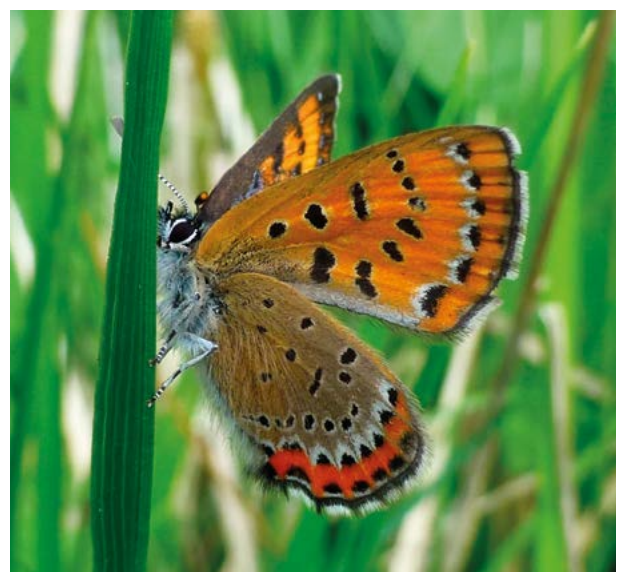
Abb. 3: Eiszeitrelikte wie der Blauschillernde Feuerfalter ( Lycaena helle ) kommen heute nur noch zurückgezogen auf inselartigen, klimatisch kühleren Standorten vor.

Der anthropogene Klimawandel zählt neben dem Landnutzungswandel zu den größten Bedrohungen der Biologischen Vielfalt und zu den wichtigsten Ursachen des Artensterbens.