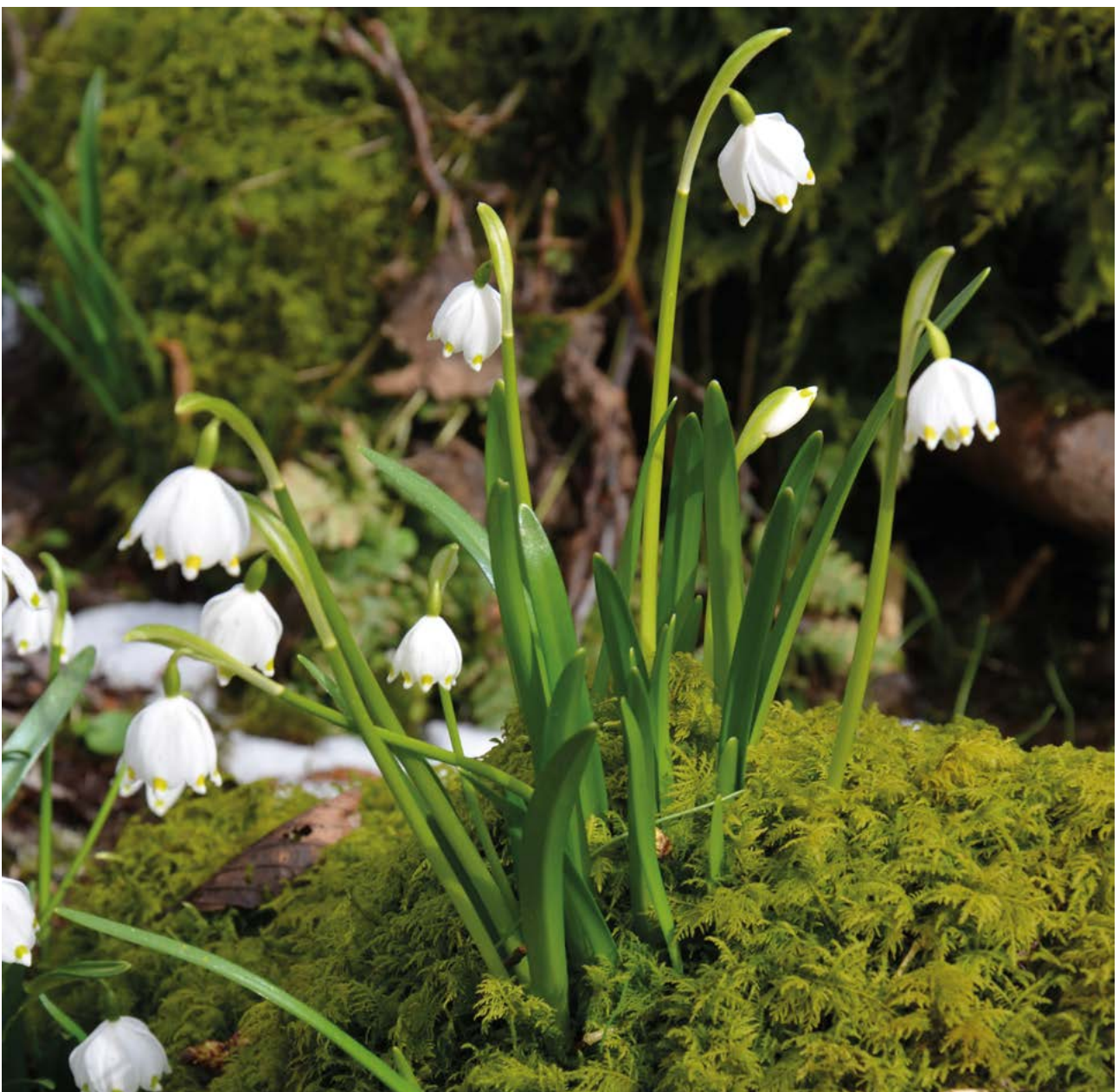
Abb. 6: Der Märzenbecher ( Leucojum vernum ) kommt in Hessen zerstreut vor, besonders aber in Auwäldern und feuchten Edellaubbaumwäldern, wie hier in einem quelligen Erlenwald im Hohen Vogelsberg. Solche Lebensräume sind durch klimabedingte Veränderungen des Wasserhaushalts potentiell bedroht.

845 Pflanzenarten in Deutschland, basierend auf unterschiedlichen Klima- und Landnutzungsszenarien. Unabhängig vom Klimaszenario wurde hierbei für einen Großteil der Arten eine Reduktion der aktuellen bioklimatischen Räume in Deutschland prognostiziert. Montan verbreitete und feuchtigkeitsliebende Arten, hierunter Arten der (alpinen) Hochstaudenfluren und Feuchtheiden, litten hierbei unter den größten Verlusten.