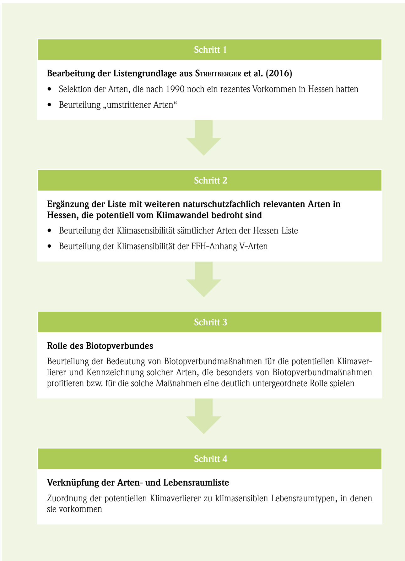
Abb. 19: Methodische Bearbeitungsschritte der Liste der potentiellen Klimaverlierer der Tier- und Pflanzenarten Hessens.