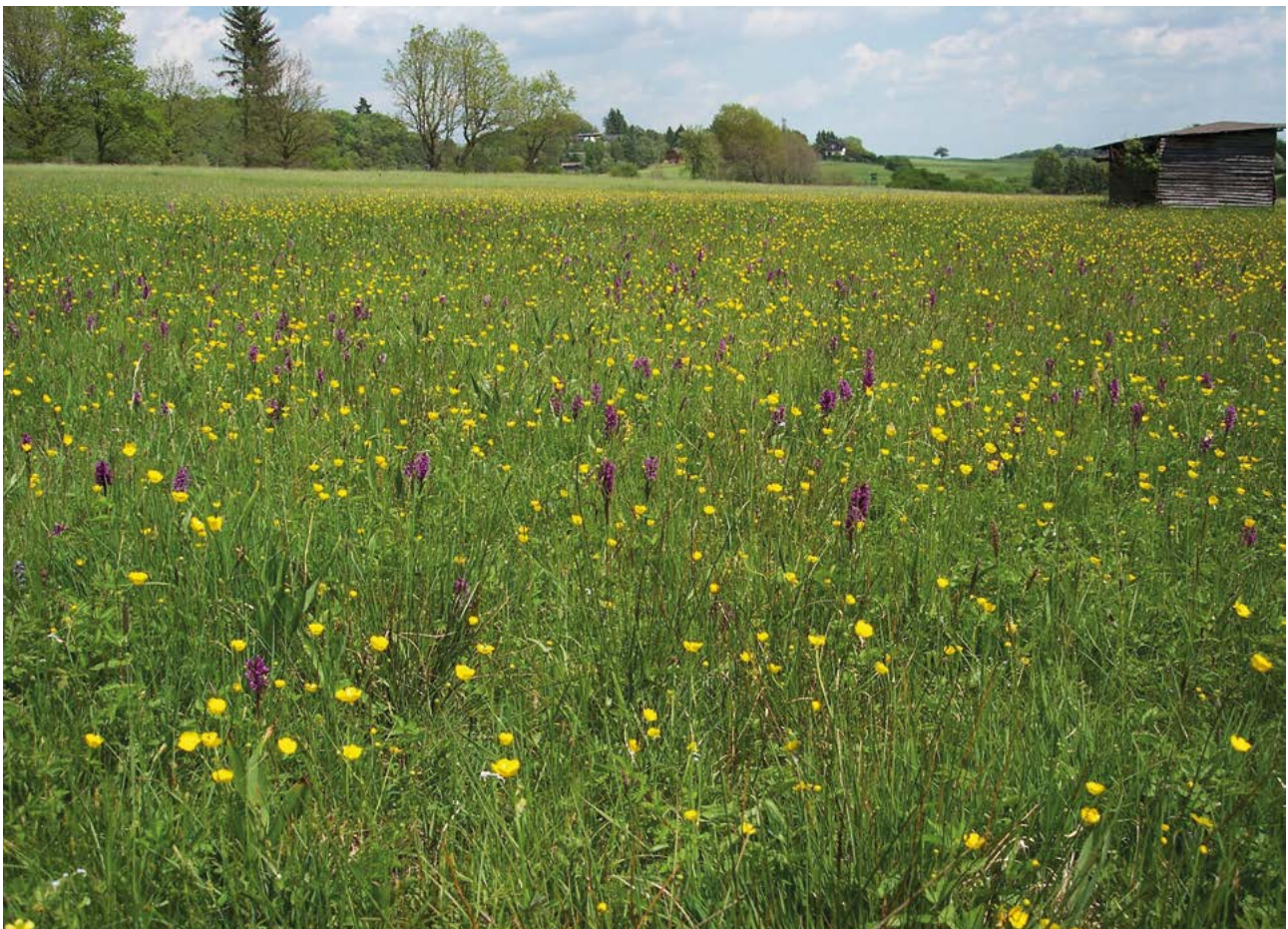
Abb. 12: Wechselfeuchte Pfeifengraswiese (LRT 6410) mit Beständen des Breitblättrigen Knabenkrautes ( Dactylorhiza majalis ). Viele potentielle Klimaverlierer unter den Tier- und Pflanzenarten kommen in solchen klimasensiblen Lebensräumen vor.

Inwiefern sich mögliche negative und positive physiologische Auswirkungen des Klimawandels auf Arten gegenseitig verstärken oder dämpfen ist noch unzureichend erforscht. Vor allem auf Ökosystemebene sind solche additiven Effekte sehr schwer vorhersehbar.