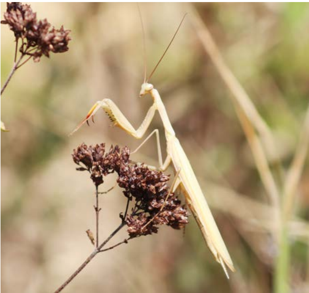
Abb. 2: Durch die Klimaerwärmung kann die Europäische Gottesanbeterin ( Mantis religiosa ) ihr Verbreitungsgebiet immer weiter nach Norden ausdehnen.

Aber auch Zuwanderungen wärmeliebender Arten etwa aus dem Mittelmeerraum sind bereits heute feststellbar. Ein Paradebeispiel für die nordwärts gerichtete Ausbreitung mediterraner Arten in Deutschland ist der Bienenfresser, ein auffallend farbenfroher Vogel aus dem Mittelmeerraum, der seit einigen Jahren wieder vermehrt in Deutschland brütet, nachdem er in den 80er Jahren als ausgestorben galt (Abb. 1). Ein weiteres imposantes Beispiel ist die Europäische Gottesanbeterin, eine Fangschreckenart, die lange Zeit als verschollen galt und sich seit 2006 wieder in Hessen etabliert hat (Abb. 2).