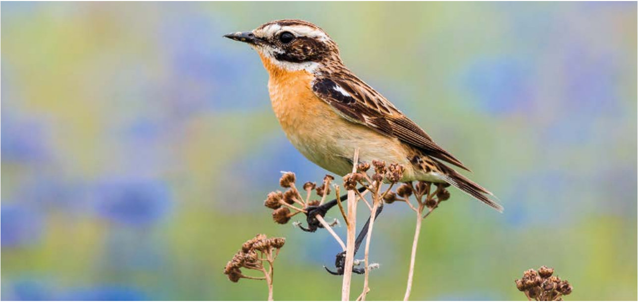
Abb. 10: Das Braunkehlchen ( Saxicola rubetra ) ist ein Brutvogel des Feuchtgrünlandes. Ähnlich wie viele andere Tier- und Pflanzenarten leidet der ehemals weit verbreitete Vogel an dem durch den Landnutzungswandel herbeigeführten Lebensraumschwund. Der Klimawandel kommt als zusätzliche Gefährdungsursache erschwerend hinzu.

Feuchtgrünlands gehören deshalb zu den potentiellen Verlierern des Klimawandels. Hinzu kommt hierbei die Gefahr der Nachwuchssterblichkeit bei erhöhten Niederschlagsraten und Starkniederschlägen während der Brutzeit (ÖBERG et al. 2015, RADFORD et al. 2001, RODRÍGUEZ & BUSTAMANTE 2003). Vor allem kleinere Stillgewässer können während der heißen Sommer immer häufiger trockenfallen. So besteht für Libellen und Amphibien beispielsweise ein erhöhtes