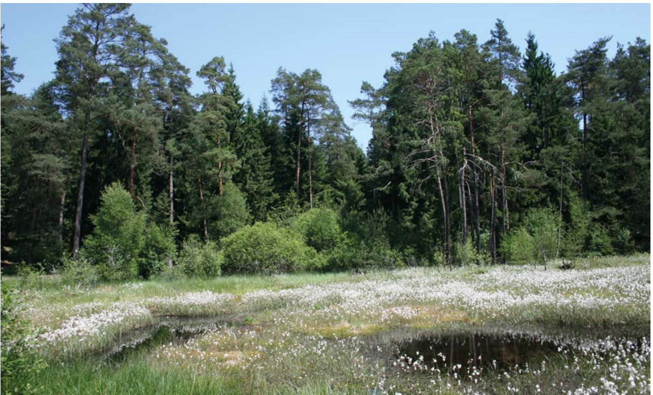
Abb. 5: Moorschutz ist Klimaschutz: Obwohl sie nur 3% der Erdoberfläche bedecken, sind Moore die effektivsten Kohlenstoffspeicher aller Landlebensräume. Moorgewässer, wie die des Burgwaldes, dienen außerdem als Lebensraum für viele seltene, oft kälteangepasste Arten.