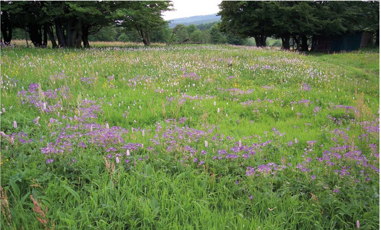
Abb. 4: Berg-Mähwiesen (LRT 6520) wie diese in Herchenhain im Vogelsbergkreis gehören zu den vom Klimawandel bedrohten Lebensräumen.