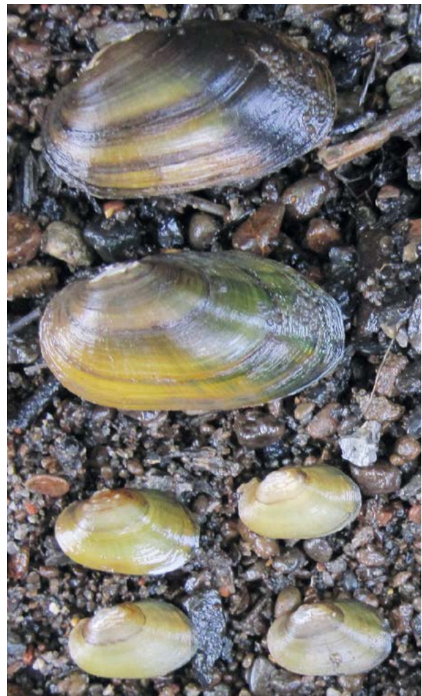
Abb. 16: Ohne geeignete Wirtsfische kann sich die Bachmuschel ( Unio crassus ) nicht vermehren. Aufgrund ihrer sessilen Lebensweise ist sie auch bei Ausbreitungsbewegungen maßgeblich auf die Wirtsfische angewiesen.

Einen besonders gut zu beobachtenden Effekt hat der Klimawandel auf die Phänologie von Zugvögeln. Zugvogelarten sind während ihres gesamten Jahreszyklus auf geeignete Bedingungen angewiesen: an ihren Brutplätzen, in den Überwinterungsgebieten und entlang ihrer Migrationsrouten. Der Klimawandel kann hier in allen drei Phasen eingreifen und den Zyklus aus dem Takt bringen, was Zugvögel besonders angreifbar macht. Es gibt immer mehr Hinweise darauf, dass vor allem Langstreckenzieher negativ beeinflusst werden, beispielsweise dadurch, dass sich ihre Ankunft im Brutgebiet und die Hauptverfügbarkeit ihrer Nahrung zeitlich nicht mehr überschneiden.