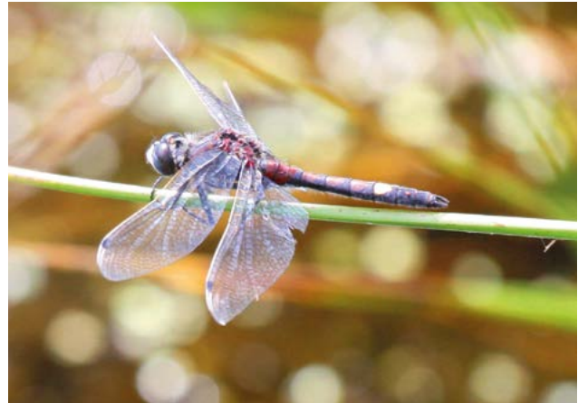
Abb. 14 und 15: Die Große Moosjungfer ( Leucorrhinia pectoralis ) mitsamt Exuvie kurz nach der Emergenz (Abb. 14). Eine mobile Art mit recht hohem Wärmebedarf, für die aufgrund des Klimawandels jedoch starke Rückgänge in Deutschland prognostiziert werden (nach JAESCHKE et al. 2014).

Tiere reagieren darauf mit einer früher einsetzenden Aktivitätsphase . Tagfalter und Libellen verlängern ihre Flugphasen und können bereits früher im Jahr beobachtet werden (OTT 2010, HASSALL et al. 2007). In ihrer Studie gehen ROY & SPARKS (2001) davon aus, dass durch eine Klimaerwärmung von 1 °C die Erstbeobachtung von Schmetterlingen um 2–10 Tage nach vorne verlegt wird. Für Libellen wurde mittels Mesokosmos-Experimenten gezeigt, dass eine Temperaturerhöhung von 5 °C die Emergenz von Libellenlarven um bis zu einem Monat früher stattfinden lässt (McCAULEY et al. 2018).