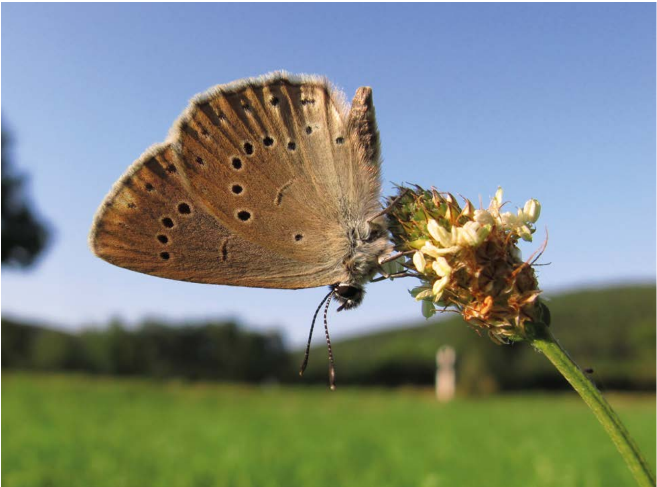
Abb. 17: Der Helle Wiesenknopf-Ameisenbläuling ( Phengaris teleius ) macht es sich nicht einfach: Nicht nur, dass sich die Raupen ausschließlich von den Blüten des Großen Wiesenknopfs ( Sanguisorba officinalis ) ernähren, sie sind zudem darauf angewiesen, als Larven von einer bestimmten Knotenameisen-Art eingesammelt und in deren Nester getragen zu werden, wo sie sich als Dank parasitisch von der Ameisenbrut ernähren.

Da sich die große Mehrheit der Vögel hauptsächlich von Insekten ernährt, die sich bedingt durch die Temperaturänderungen und den verfrühten Vegetationsbeginn bereits früher entwickeln, sind vor allem solche Vögel bedroht, die ihr Zugverhalten nicht an den Klimawandel anpassen (BOTH et al. 2006, HOWARD et al. 2018, MÖLLER et al. 2008).