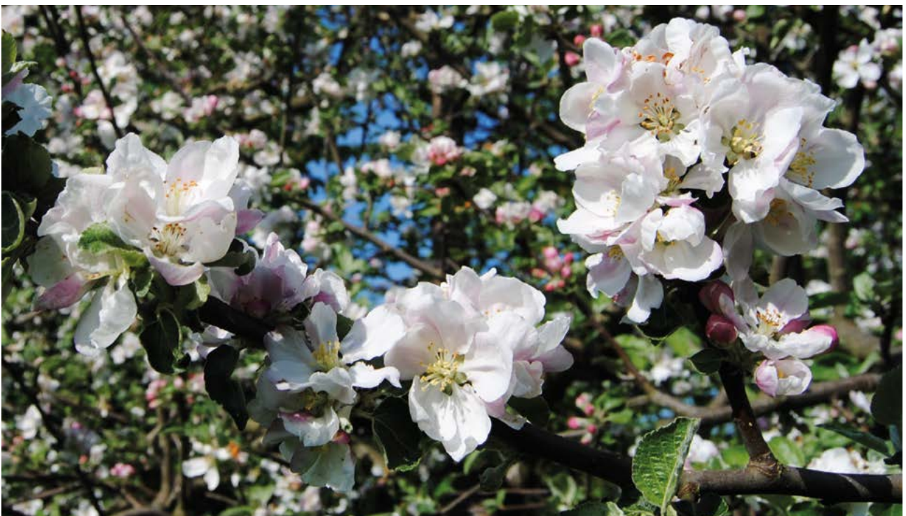
Abb. 13: Der Klimawandel dreht an den Stellschrauben der phänologischen Uhr: Vor allem der Frühling beginnt heute bereits deutlich früher und auch die Obstblüte verfrüht sich infolge der Erwärmung.

ten: Frühling und Sommer beginnen bereits deutlich früher im Jahr und halten auch länger an, wodurch die Vegetationsphase verlängert und die Vegetationsruhe (Spätherbst und Winter) verkürzt wird. In Hessen reduzierte sich die Vegetationsruhe in manchen Gebieten im Zeitraum 1981–2010 gegenüber 1951–1980 um mehr als 4 Wochen (HLNUG, Fachzentrum Klimawandel und Anpassung 2017).