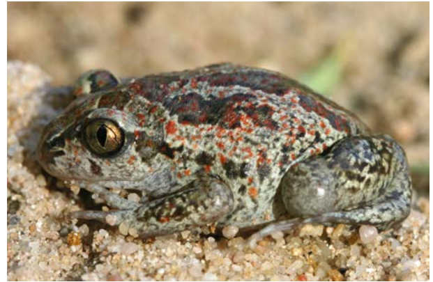
Abb. 8 und 9: Amphibien sind durch ihre Lebensweise stark an Gewässer gebunden und besonders abhängig von einem funktionalen Biotopverbund. Vor allem ihre Reproduktionsgewässer sind durch die veränderten Niederschlagsmuster in Folge des Klimawandels von einer erhöhten Austrocknungsgefahr betroffen. (Abb. 8: Feuersalamander, Salamandra atra, Abb. 9: Knoblauchkröte, Pelobates fuscus)

Bedrohung und stellt auch den klassischen Naturschutz vor neue Aufgaben (vgl. auch ÅREVALL et al. 2018 und ALAGADOR et al. 2016).