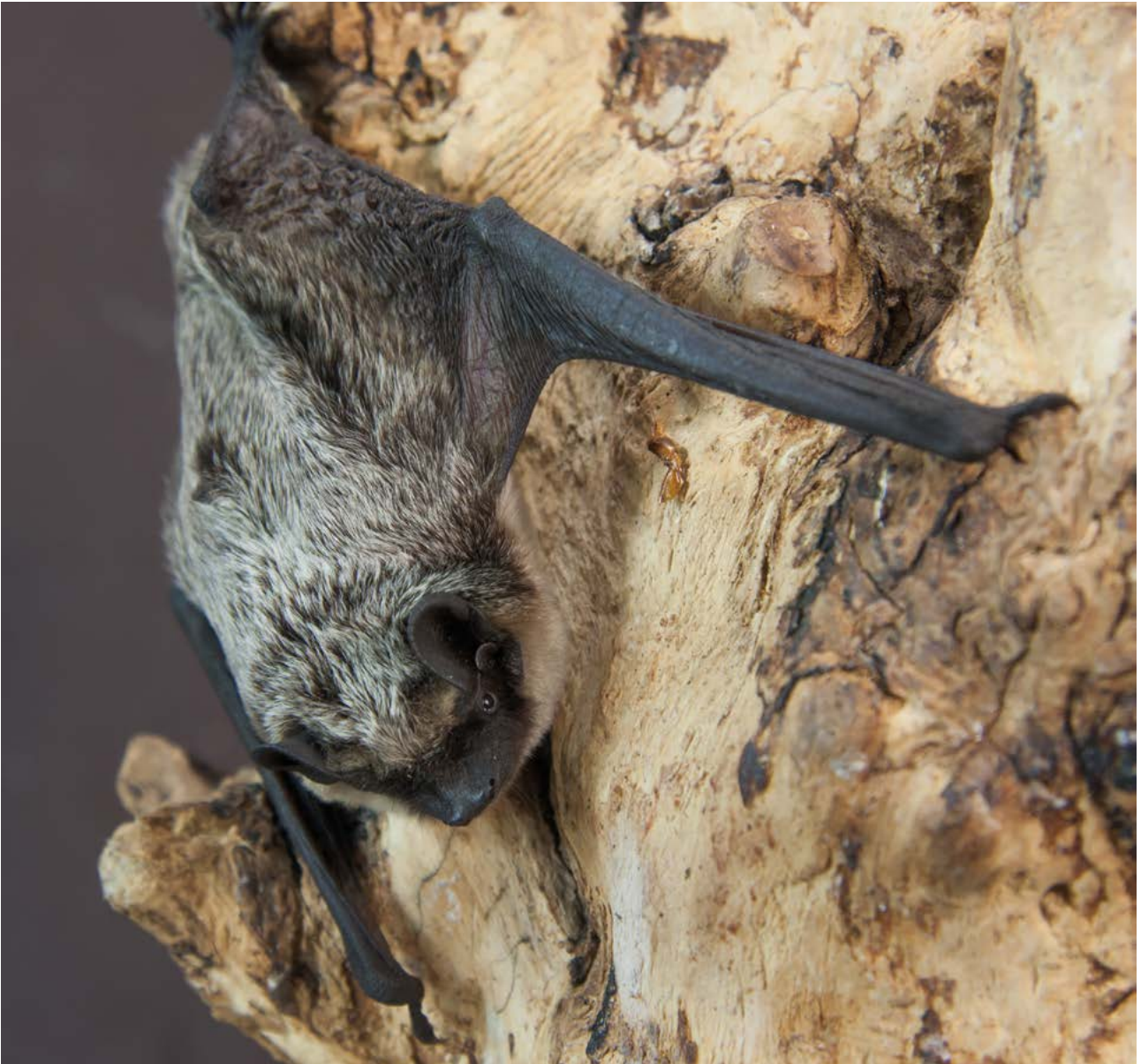
Abb. 7: Für die Zweifarbfledermaus ( Vespertilio murinus ) wird in Folge des Klimawandels eine starke Reduktion des Verbreitungsreals prognostiziert (nach REBELO et al. 2010).

Für süd- und mitteleuropäische Fledermausarten konnten REBELO et al. (2010) mit Hilfe von Verbreitungsmodellierungen für zwei moderate IPCC-Klimaszenarien kaum negative Effekte auf die Verbreitungsareale feststellen. Einige Arten könnten ihr Verbreitungsgebiet mittelfristig sogar erweitern. Ein anderes Bild ergibt sich für Fledermausarten mit borealem Verbreitungsschwerpunkt, die auch unter den moderaten Klimaszenarien bereits Arealeinbußen erfahren würden. Allgemein zeigt sich: Je länger der betrachtete Prognosezeitraum und je extremer das zugrundeliegende Klimaszenario, umso schwerwiegender sind die Konsequenzen, auch für wärmeangepasste Arten.