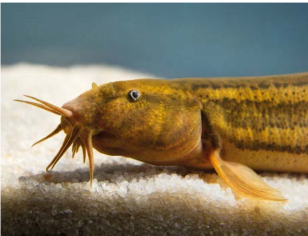
Abb. 11: Trotz seiner hervorragenden Anpasstheit an Sauerstoffmangel und das kurzzeitige Trockenfallen der Gewässergräben, in denen er vorkommt, können langanhaltende Dürreperioden die physiologischen Kapazitäten des Schlammepeitzgers ( Misgurnus fossilis ) ausreizen.

Feuchtgrünlands gehören deshalb zu den potentiellen Verlierern des Klimawandels. Hinzu kommt hierbei die Gefahr der Nachwuchssterblichkeit bei erhöhten Niederschlagsraten und Starkniederschlägen während der Brutzeit (ÖBERG et al. 2015, RADFORD et al. 2001, RODRÍGUEZ & BUSTAMANTE 2003). Vor allem kleinere Stillgewässer können während der heißen Sommer immer häufiger trockenfallen. So besteht für Libellen und Amphibien beispielsweise ein erhöhtes